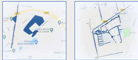
De Ed Stoop-vijvers in Roden (links) en Leek.