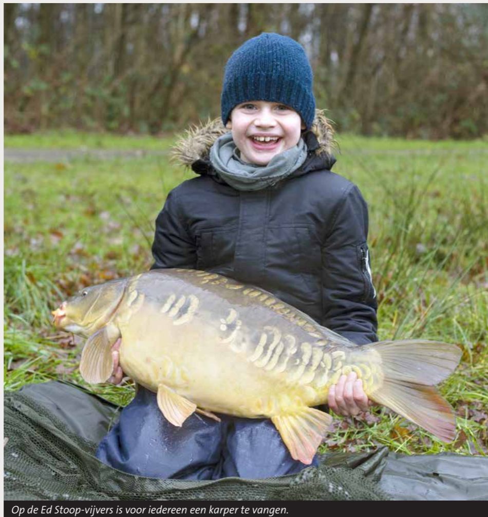
Op de Ed Stoop-vijvers is voor iedereen een karper te vangen.

Je vindt deze Ed Stoop-vijvers bijvoorbeeld in Leek (Oostindie) en Roden (aan de Dwazziewegen). Maar hoe pak je het daar nou aan? Het belangrijkste bij het karpervissen is dat je vist in de buurt van de karper. Dit betekent dat je je ogen goed de kost moet geven om elk teken van karper op te sporen. Je hebt het op een warme, zomerse dag vast al eens meegemaakt dat grote, donkere schimmen vlak onder het wateroppervlak geruisloos voorbij schuiven. Maar de karpers verraden zich geregeld ook door kleine belletjes, bewegende rietstengels en soms zelfs door volledig uit het water te springen. Besteed aan het begin van je sessie tijd aan het zoeken van de vis, voordat je gaat vissen.