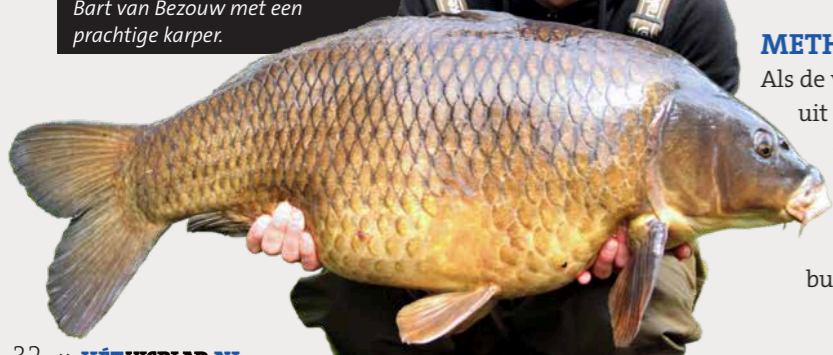
Bart van Bezouw met een prachtige karper.

de stad Groningen vist, dan is de methodfeeder een aanrader. Door wat kleine pellets kort in water te weken, kun je ze met behulp van een malletje op de methodfeeder drukken en daar vervolgens ook je haakaas in verstopten. Als hengel volstaat een normale winkle picker of een feederhengel, een molen met een goede slip en lijnclip en 25/00 nylon. Een gouden tip voor deze visserij is om zo compact mogelijk te voeren en te vissen en regelmatig bij te voeren. Door elke keer je voer en aas op de zelfde vierkante meter te leggen, ontstaat er voedselnijd en zal je veel meer gaan vangen. Vergeet ook niet om tijdens de sessie een voerplekje vlak onder de kant aan te maken en daar elk kwartier een klein handje voer op te gooien. Keer op keer levert dat ene plekje aan het einde van de sessie nog de dikste karper op ook!