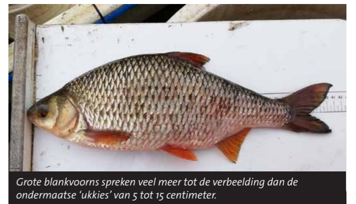
Grote blankvoorns spreken veel meer tot de verbeelding dan de ondermaatse 'ukkie's' van 5 tot 15 centimeter.

De omstandigheden in de winter – als de voorns zich verzamelen op beschutte plekken zoals havens – zijn anders dan op de gemiddelde zomerdag. Toch zijn er parallellen: in welk jaargetijdje dan ook, dirigeer je met lokvoer meestal vooral het kleine spul naar je haakaas. Ballen voer vallen nu eenmaal in het water altijd uiteen in microscopisch kleine deeltjes en dat hapt zo heerlijk weg als je nog maar een ukkie bent. Voor wedstrijdvisser dient voer vaak hoofdzakelijk als transportmiddel om aas op de stek naar de bodem te krijgen. Op de casters en gekiemde hennep die ze door hun voer mengen, komen juist de wat grotere voorns af.