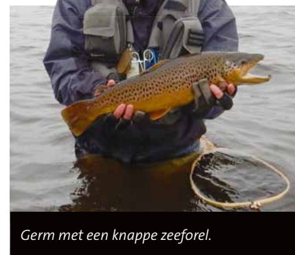
Germ met een knappe zeeforel.