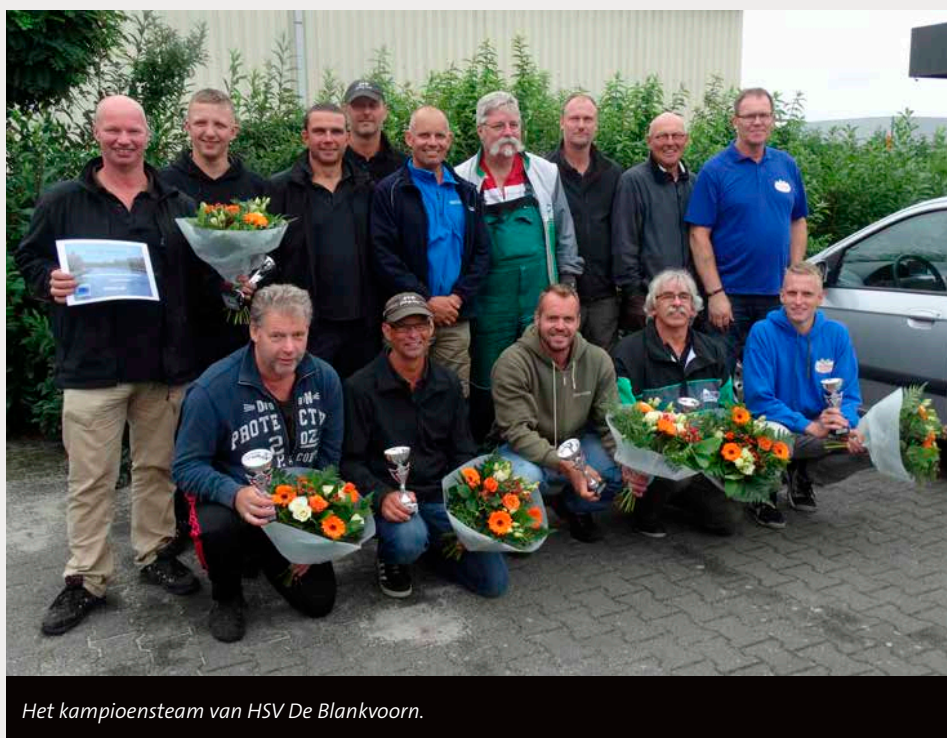
Het kampioensteam van HSV De Blankvoorn.

De teams die meedoen zijn enthousiast. De wedstrijden zijn van begin af aan spannend: je moet immers winnen om een ronde verder te komen. De vereniging die verliest ligt eruit. De winnaars gaan een ronde verder, totdat er uiteindelijk drie verenigingen overblijven die de finale vis- sen. Meedoen? Zorg dan dat je met mini- maal vijf vissers bent van dezelfde vereni- ging. Er is zoals gezegd geen maximum. Laat de vereniging je team aanmelden bij de federatie. Dit moet vóór 1 april 2017 ge- beuren. De federatie verricht de loting en stelt het wedstrijdschema vast. Vanaf dit jaar is er ook een landelijke finale, geor- ganiseerd door Sportvisserij Nederland. Hierin strijden de beste teams uit de zeven federaties om de titel 'Clubkampioen van het jaar'.