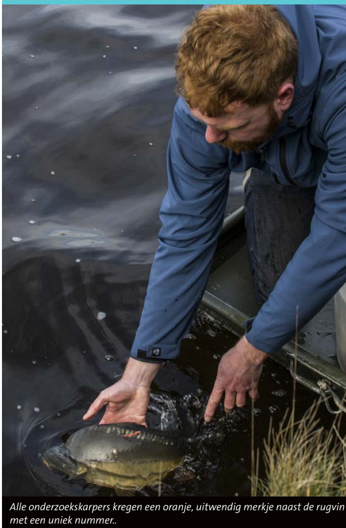
Alle onderzoekskarpers kregen een oranje, uitwendig merkje naast de rugvin met een uniek nummer.

Tussen karpers onderling zit groot verschil. Sommige verplaatsen zich nauwelijks, andere vissen gaan juist op avontuur. Zoals karper 344 die op 28 februari 2015 in het Noord-Willemskanaal werd uitgezet ter hoogte van de RWZI bij Eelde. Deze vis is kort daarna gaan zwerven en via het Eemskanaal en Winschoterdiep in het Zuidlaardermeer beland. Hier verbleef de vis bijna twee jaar. In het voorjaar van 2017 zwom de vis terug naar de uitzetlocatie in het Noord-Willemskanaal, om ongeveer een week later weer op te duiken in het Zuidlaardermeer. Dezelfde reis maakt de vis daarna nog tweemaal in korte tijd.