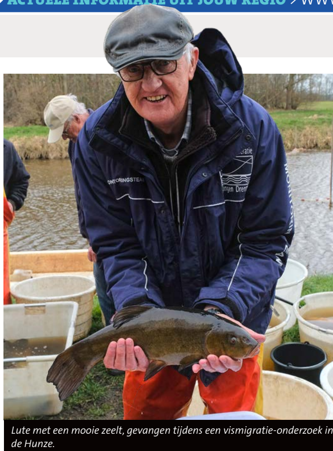
Lute met een mooie zeelt, gevangen tijdens een vismigratie-onderzoek in de Hunze.