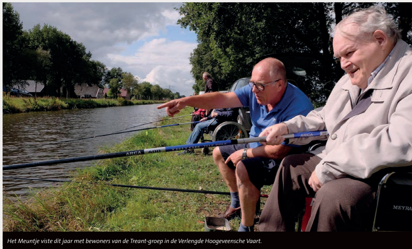
Het Meuntje viste dit jaar met bewoners van de Treant-groep in de Verlengde Hoogeveense Vaart.

Een kwart van de bewoners van verpleeghuizen komt nooit meer buiten omdat ze daar zelf niet toe in staat zijn of er geen begeleiding is die met ze mee kan. Het project Visserslatijn dat onze federatie met IVN Regio Noord uitvoert komt daarom als geroepen. In dit project gaan bewoners van zorgcentra die zelf niet meer naar buiten kunnen een dagje vissen met vrijwilligers van de plaatselijke hengelsportvereniging.