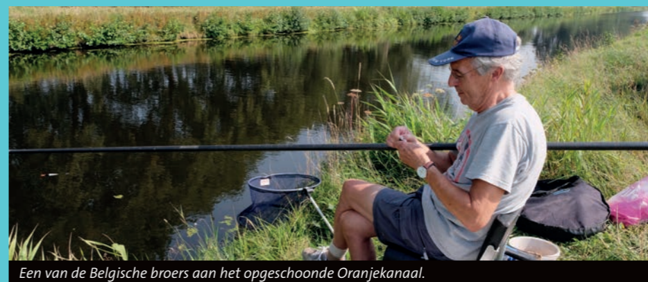
Een van de Belgische broers aan het opgeschoonde Oranjekanaal.