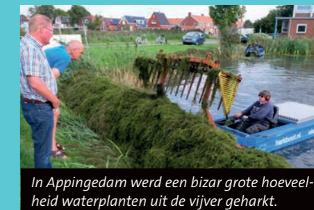
In Appingedam werd een bizar grote hoeveelheid waterplanten uit de vijver geharkt.