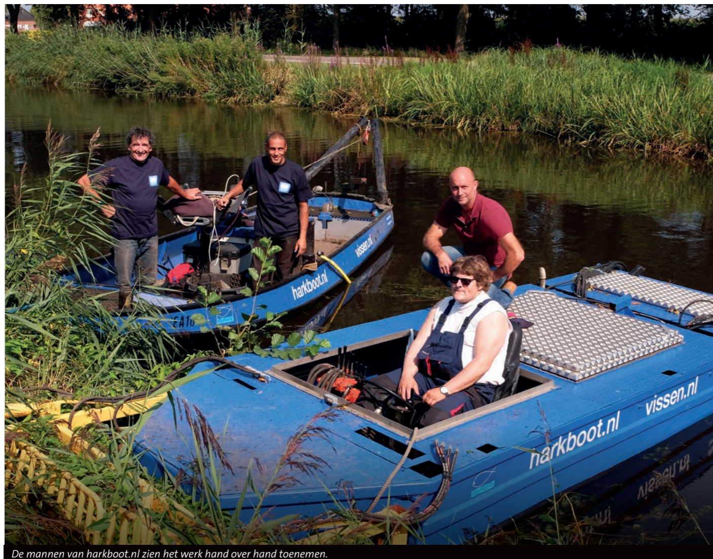
De mannen van harkboot.nl zien het werk hand over hand toenemen.