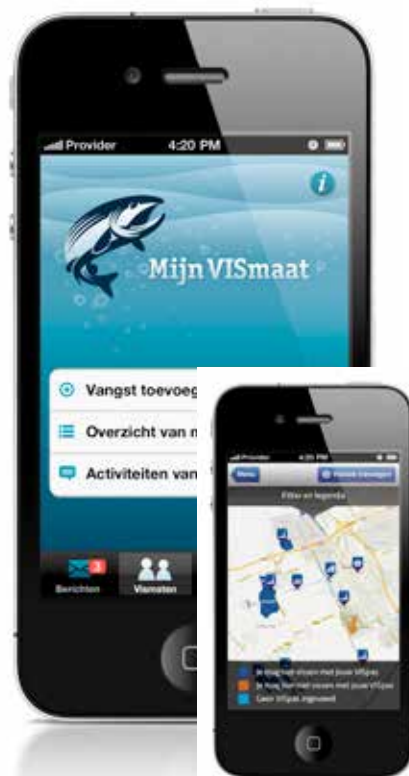
Mijn VISmaat App en de VISplanner de ideale combinatie voor de visser