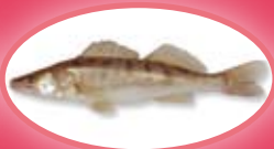
Snoekbaars - 42 cm