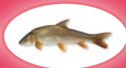
Barbeel - 30 cm