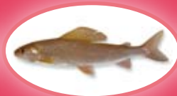
Vlagzalm - 35 cm