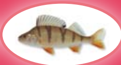
Baars - 22 cm