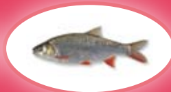
Winde - 30 cm