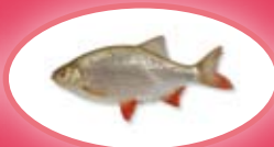
Riet-/ruisvoorn - 15 cm