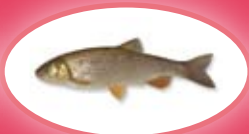
Kopvoorn - 30 cm

* bron- beek- en regenboogforel en beekrider