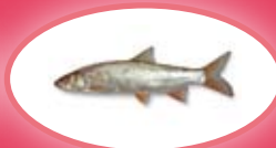
Sneep - 30 cm