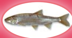
Serpeling - 15 cm