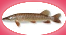
Snoek - 45 cm