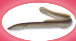
Paling - 28 cm