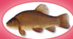
Zeelt - 25 cm