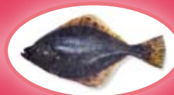
Bot - 20 cm