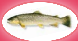
Forel* - 25 cm

* bron- beek- en regenboogforel en beekrider